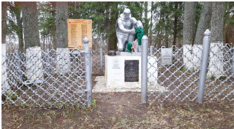
Братское захоронение в с. Стрельня до реконструкции.